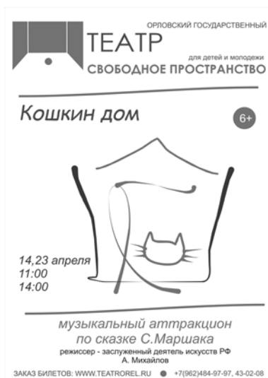
Рис. 7. Афиша спектакля «Кошкин дом»