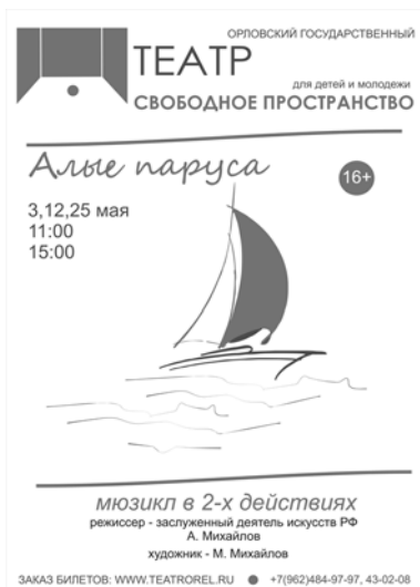
Рис. 5. Афиша спектакля «Алые паруса»