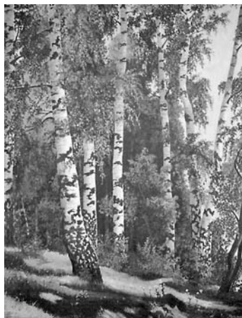
Рис. И.И. Шишкин «Берёзовая роща». 1896

Предварительная подготовка: выразительное чтение наизусть стихотворения С. Есенина «Белая берёза под моим окном» (читает ученик).