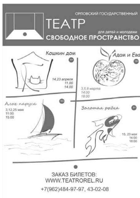
Рис. 8. Афиша театра на месяц

Взяв за основу дизайн плакатов, можно легко развить полный фирменный стиль театра, что является важным направлением маркетинга. Выполнение всех афиш в определённой цветовой гамме с утверждёнными шрифтами делает их заметными и узнаваемыми на информационных стендах. В том же стиле можно сделать оформление сайта театра, листовок с репертуаром на каждый месяц (рис. 8), театральных билетов, информационного стенда с контактной информацией театра. Это создаст единое пространство информационных материалов, дополняющих друг друга.