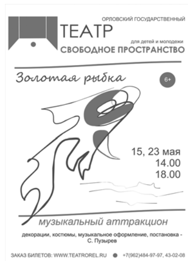
Рис. 6. Афиша спектакля «Золотая рыбка»