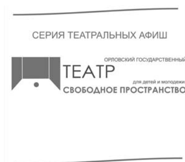
Рис. 3. Основа афиши

В идеале театральная афиша должна быть носителем не только образа спектакля, но и имиджа театра. Ниже представлена серия авторских афиш, разработанных на основе эскизирования и общих впечатлений от проводимых спектаклей в театре «Свободное пространство». Общая концепция афиш основана на зарисовках, сделанных во время просмотра спектаклей. Визуальный язык строится из элементов, взятых со сцены. Работы выполнены в фирменных цветах предлагаемого логотипа театра.